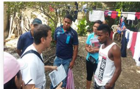
Imagen charlas a los estudiantes de la Universidad San Buenaventura, en el patio de Hilda Edith Monterosa Iriarte, marzo 05/03/2014, Foto: Rigoberto Castro Pérez

EL POZÓN, trv 57 81-12 con Mz 50 L02 Celular: 3 12 - 6 15 3 1 4 8 Correo electrónico: fundacioncasamuseopozon@gmail.com https://fundacion-casa-museo-pozon.webnode.com.co/