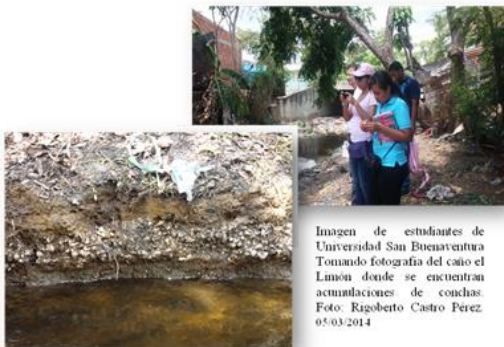
Imagen de estudiantes de Universidad San Buenaventura Tomando fotografía del caño el Limón donde se encuentran acumulaciones de conchas. 05/03/2014