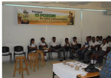
Exposición de los restos de cerámicas y otros artefactos, encontrados en el sector La Isleta. Foto: Rigoberto Castro Pérez, 04/02/2014